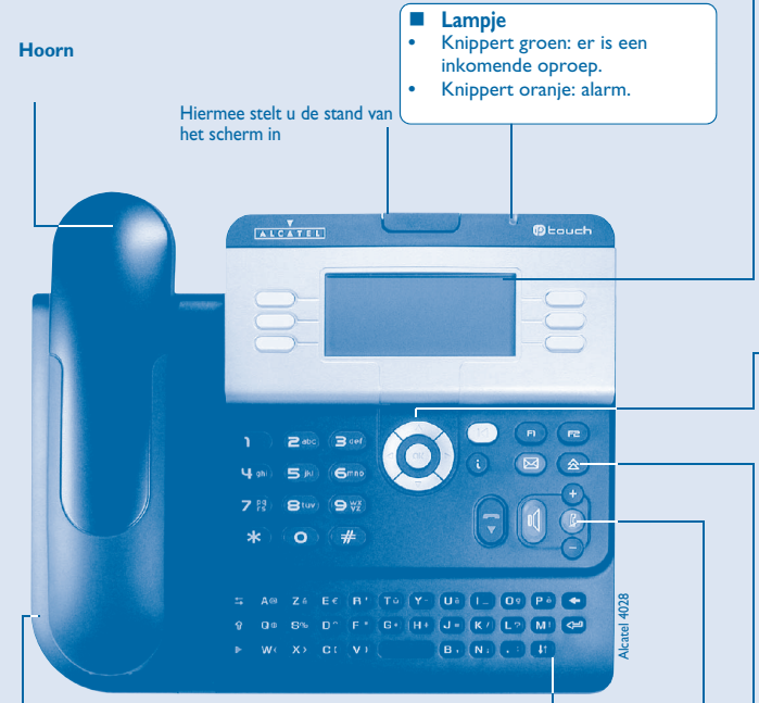
Aansluiting voor een headset, een handsfree apparaat of een luidspreker